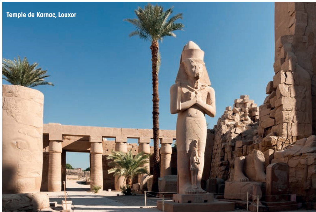
Temple de Karnac, Louxor

NB : Pour des raisons de sécurité de navigation, la compagnie et le capitaine du bateau sont seuls juges pour modifier l'itinéraire de la croisière. Cette croisière est sous l'influence de la marée et les horaires d'arrivée aux escales peuvent être modifiés.