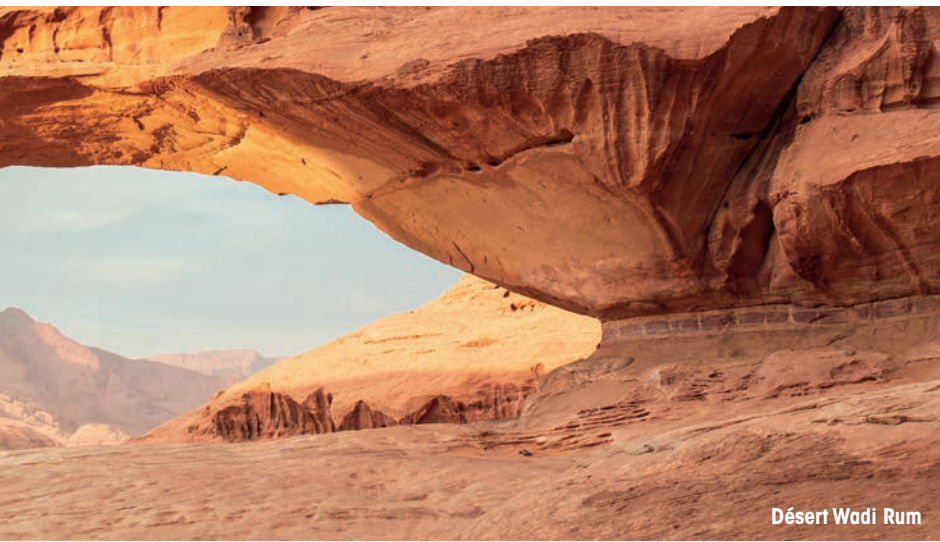
Désert Wadi Rum