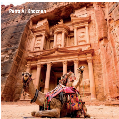
Petra Al Khazneh

creux de la montagne thébaine, vous rejoindrez ce lieu mythique qui vous plonge dans plus de 4 000 ans d'histoire. Symbole du royaume des morts et classé au patrimoine mondial de l'Unesco, la vallée des Rois regroupe les sépultures des plus grands pharaons : Aménophis II, Ramsès XI ou encore Toutankhamon. Les 62 tombes creusées à même la montagne ne sont pas toutes accessibles au public, mais vous visiterez trois d'entre elles, dont le tombeau de Sèti 1er le plus grand et mieux conservé des 64 tombeaux de la vallée des rois. Plus loin, dominant la rive occidentale du haut de leurs 18 mètres, les colosses de Memnon, effigies sans visages assises sur un trône sont les vestiges