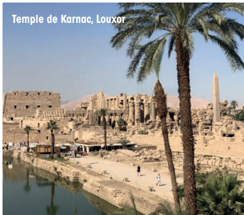
Temple de Karnac, Louxor

DÉSERT DE WADI RUM (déjeuner inclus). Classé au patrimoine mondial de l'UNESCO, c'est à bord d'une Jeep que vous parcourrez ce magnifique désert. Les sables aux couleurs vives et les formations rocheuses austères en font l'une des visites incontournables de Jordanie. Le paysage n'a guère changé depuis l'époque où