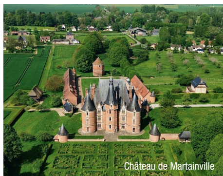
Château de Martainville

● AUTHENTIQUE / EXPÉRIENCE : visite du château de Martainville . Jacques Le Pelletier, armateur de la ville de Rouen, fait construire ce château au XVI e siècle. Plus tard son neveu, qui hérite de toute sa fortune, entreprend de grands travaux d'aménagement et le château s'impose parmi l'un des tous premiers édifices de la Renaissance normande. Aujourd'hui, il abrite le musée des Traditions et Arts Normands et ses exceptionnelles collections retracent l'histoire des arts et traditions populaires de la Haute-Normandie. Plus de 15000 œuvres y sont exposées de manière permanente. Retour à bord et continuation de la navigation vers Honfleur.