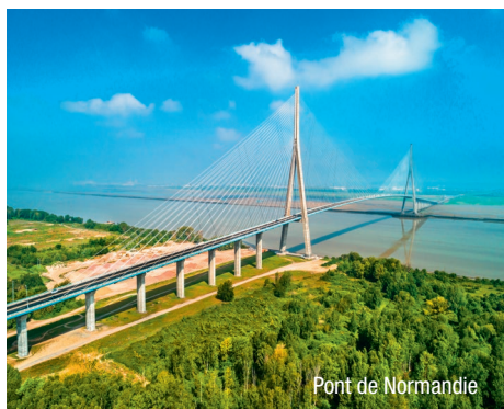
Pont de Normandie