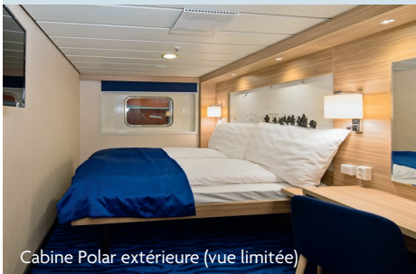
Cabine Polar extérieure (vue limitée)

Ces 2 navires modernes, récemment rénovés ont une capacité de 590 passagers. Le MS Nordlys doit l'inspiration de son nom et de son design intérieur à la beauté des Aurores Boréales. Quant au MS Nordnorge, il tient son nom de la Norvège du Nord, située au delà du Cercle Arctique.