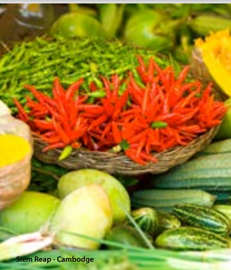
Siem Reap - Cambodge