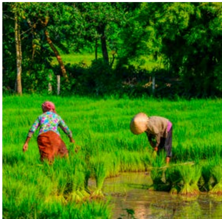
Femmes dans une rizière - Vietnam

Très tôt le matin, magnifique navigation jusqu'à My Tho par le canal de Chao Gao qui permet de passer de la rivière Saigon au delta du Mékong. Petit déjeuner et arrivée à My Tho "La bonne herbe parfumée" selon la traduction, l'un des plus luxuriants jardins du Vietnam (cocotiers, bananiers, manguiers...). Sur la plus grande des îles, Thoi Son, visite d'une ferme d'apiculture et dégustation de thé au miel. Ensuite, navigation dans de petits sampans sur ce canal bordé de palmiers d'eau qui laisse apercevoir la vie des villageois. Retour à bord pour le déjeuner et navigation jusqu'à Vinh Long/Caï Be. Vinh Long, terre rendue riche par les alluvions, est le pays des mandarines et des oranges. Départ en petits bateaux à travers les canaux et les vergers qui mènent vers Cai Be. Découverte d'une briqueterie, d'une pépinière d'arbres fruitiers ainsi que d'une fabrique artisanale de riz soufflé. Puis départ en direction de Sa Dec. Dîner et nuit à bord.