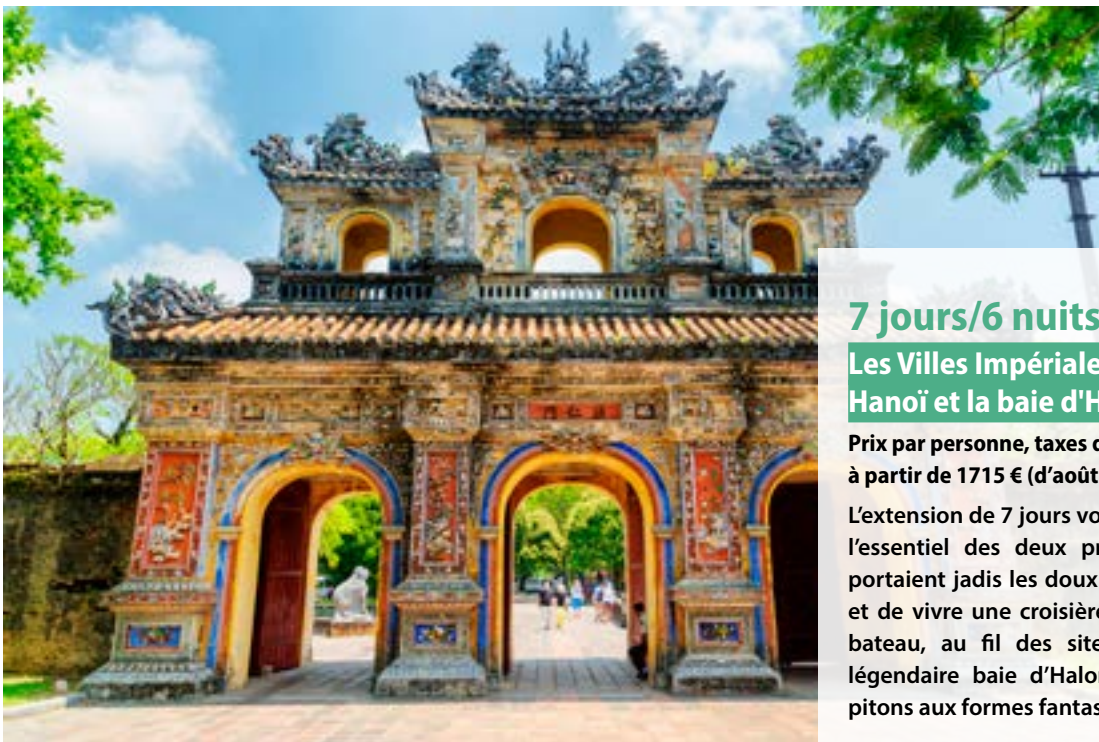
Huế - Vietnam