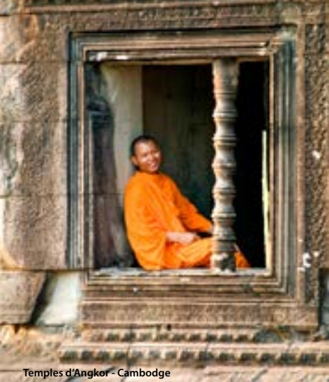
Temples d'Angkor - Cambodge

Que vous ayez soif de culture, envie de relaxation ou désir de rencontre, ce voyage aux confins du Vietnam et du Cambodge vous fera découvrir de véritables «petits paradis entre ciel et eau» au fil du fleuve Mékong. La magie des temples et des pagodes vous attend ainsi que les us et coutumes de ces peuples généreux et accueillants, sans parler des mille et une saveurs qui flatteront votre palais. Laissez-vous guider, ce voyage inoubliable saura vous combler !