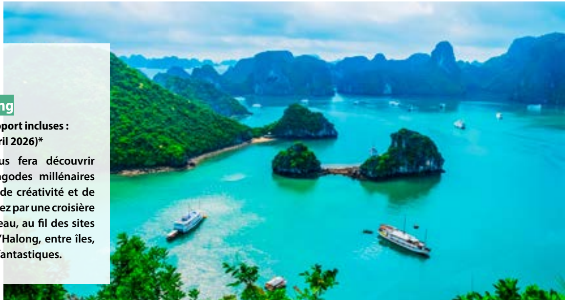
Baie d'Halong - Vietnam

L'extension de 4 jours vous fera découvrir Hanoï, la capitale, entre pagodes millénaires et échoppes qui fourmillent de créativité et de bonne humeur. Vous terminerez par une croisière romantique, à bord d'un bateau, au fil des sites incontournables de la baie d'Halong, entre îles, criques et pitons aux formes fantastiques.