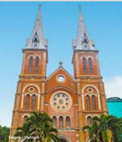
Saigon - Vietnam

Que vous ayez soif de culture, envie de relaxation ou désir de rencontre, ce voyage aux confins du Vietnam et du Cambodge vous fera découvrir de véritables «petits paradis entre ciel et eau» au fil du fleuve Mékong. La magie des temples et des pagodes vous attend ainsi que les us et coutumes de ces peuples généreux et accueillants, sans parler des mille et une saveurs qui flatteront votre palais. Laissez-vous guider, ce voyage inoubliable saura vous combler !