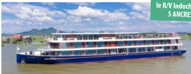
le R/V Indochine II 5 ANCRES