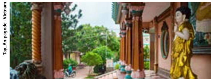
Tay_An-pagode - Vietnam

Fondée en 1434, la capitale du Cambodge, grâce à la réhabilitation de son patrimoine architectural, conserve beaucoup de charme. Visite de la Pagode d'Argent et du Palais Royal, coeur symbolique de la nation et l'un des plus beaux exemples d'architecture