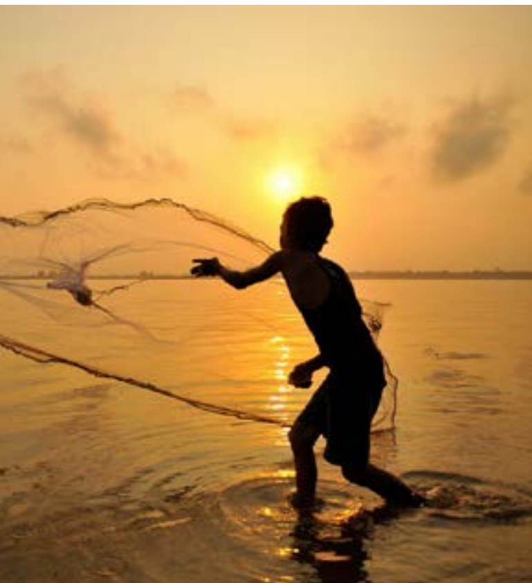
Lac Tonlé - Cambodge

Cocktail et dîner d'au revoir. Nuit à bord.