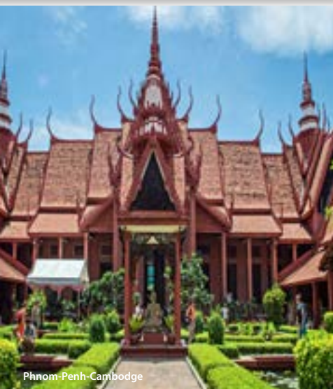
Phnom-Penh - Cambodge