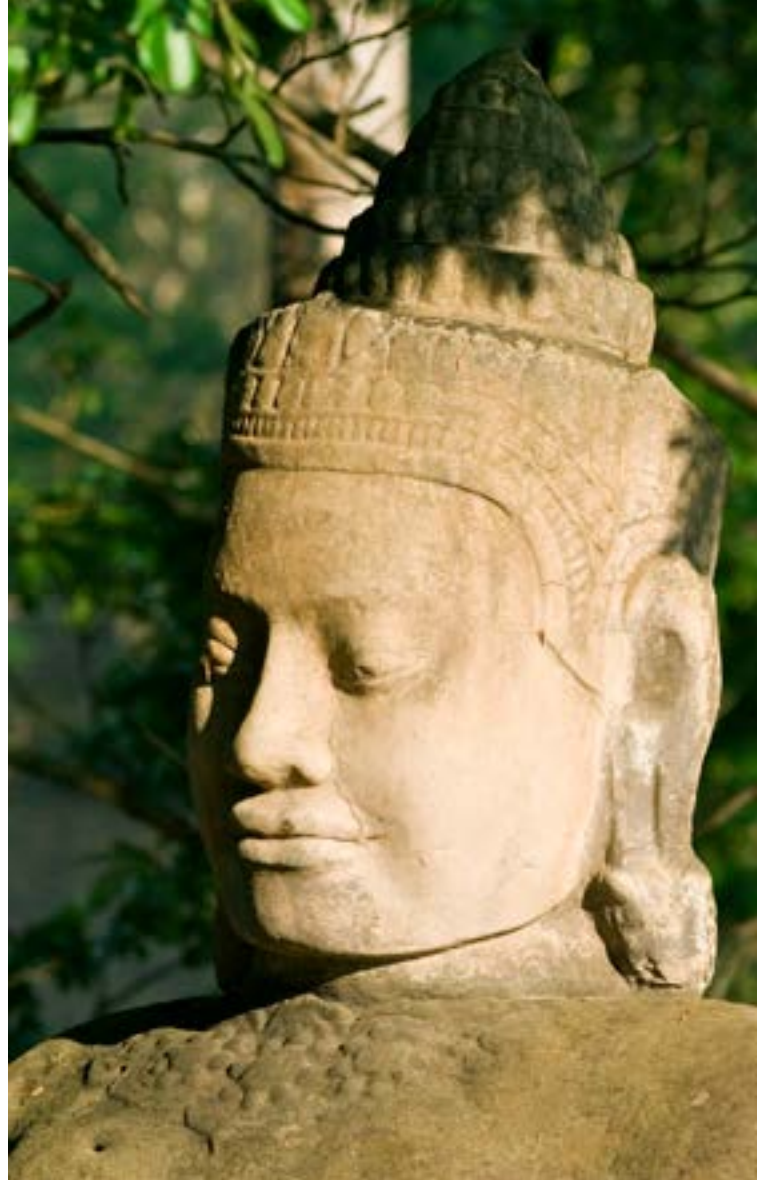
Temples d'Angkor - Cambodge

N.B. : L'itinéraire, les escales ou les visites pourront être modifiés par l'armateur et nos représentants sur place. Les excursions pourront être modifiées ou inversées en cas de nécessité. Le commandant est seul juge pour modifier l'itinéraire du bateau pour des raisons de sécurité et de navigation. *Traversée du lac Tonlé : en période de hautes eaux, en principe d'août à fin novembre, la traversée s'effectue avec le bateau RV Indochine (ou II). En période de basses eaux, de décembre à février, la traversée du lac se fait en bateaux rapides pour rejoindre le RV Indochine (ou RV Indochine II) à Koh Chau. Enfin, en période de très basses eaux, aux environs de février à avril, le transfert de Siem Reap à Koh Chen où se trouve le bateau s'effectue en autocar climatisé / L'abus d'alcool est dangereux pour la santé, à consommer avec modération.