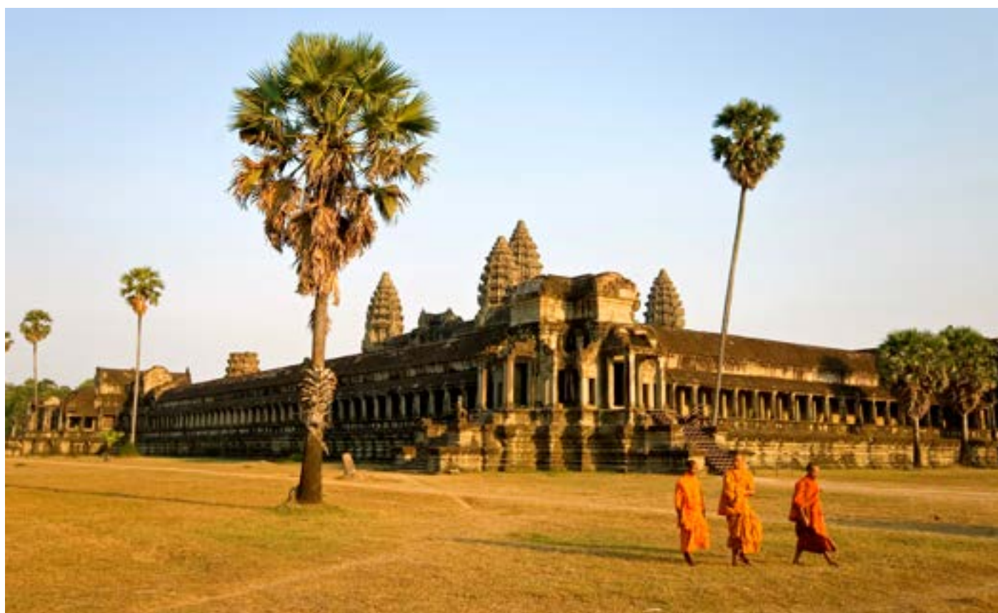
Temples d'Angkor - Cambodge

Renseignements & réservation au 01 41 33 56 56