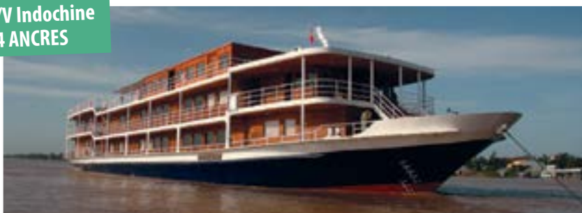
le R/V Indochine 4 ANCRES