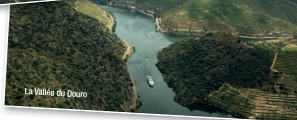
La Vallée du Douro

CroisiEurope Les croisières, c'est notre métier.