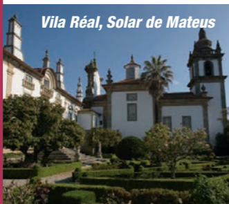
Vila Real, Solar de Mateus