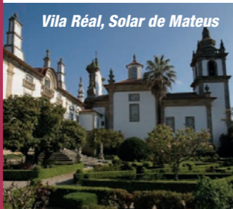
Vila Réal, Solar de Mateus