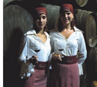
Dégustation de vins de Porto

Visite guidée de Porto, une des plus anciennes villes d'Europe. Joyaux architectural, vous découvrirez ses vieux quartiers encore intacts, ses ruelles tortueuses et pittoresques et ses maisons à arcades. Elle est reconnue pour son art de bien vivre, à savoir sa gastronomie de qualité et l'accueil chaleureux de ses habitants. Cette visite sera suivie d'une dégustation de vins de Porto dans les chais de la Vila Bova de Gaia . Après-midi en navigation. Escale de nuit à Régua.