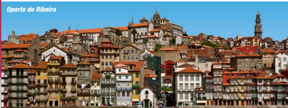
Oporto de Ribeira