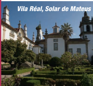
Vila Real, Solar de Mateus