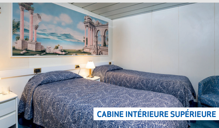
CABINE INTÉRIEURE SUPÉRIEURE

Les extérieurs aux ponts Promenade, Calypso, Navigators et Observation sont agréablement équipés de chaises longues, d'une petite piscine et d'un bar en terrasse. Les différents ponts du bateau sont desservis par deux ascenseurs.