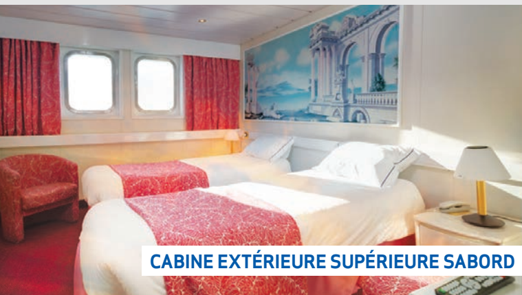
CABINE EXTÉRIEURE SUPÉRIEURE SABORD

Le M/S ASTORIA récemment rénové, possède le charme des navires d'autrefois, de ceux qui ont une âme. D'inspiration Art déco, son décor et son mobilier composent un cadre soigné et confortable. Un éclairage chaleureux, un habillage de bois clair et de cuivre soulignent son design élégant.