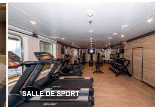
SALLE DE SPORT