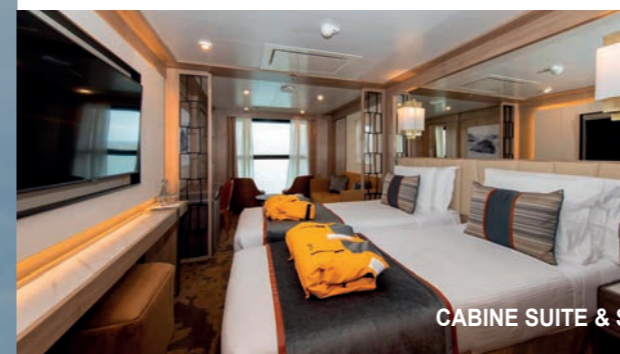
CABINE SUITE & SON SALON

Compagnie : Quark Expeditions Date d'entrée en service : 2019 Dimension : 19m x 126m Tonnage : 9 300 tonnes Cabines : 86 Capacité : 176 passagers Équipage : 125 membres Nombre de ponts : 6 Vitesse de croisière : 16 nœuds Langues parlées à bord : Anglais, Espagnol, Français, Italien Moteurs Rolls Royce hybride de 9300 KW