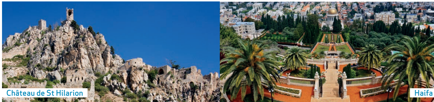
Château de St Hilarion