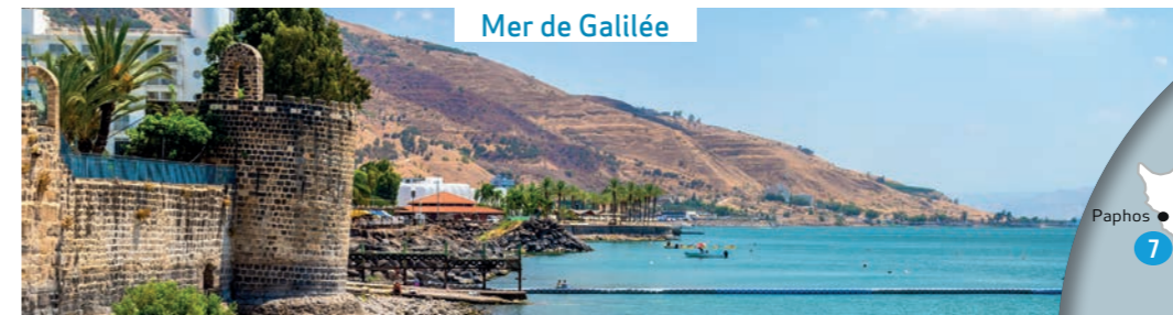
Mer de Galilée