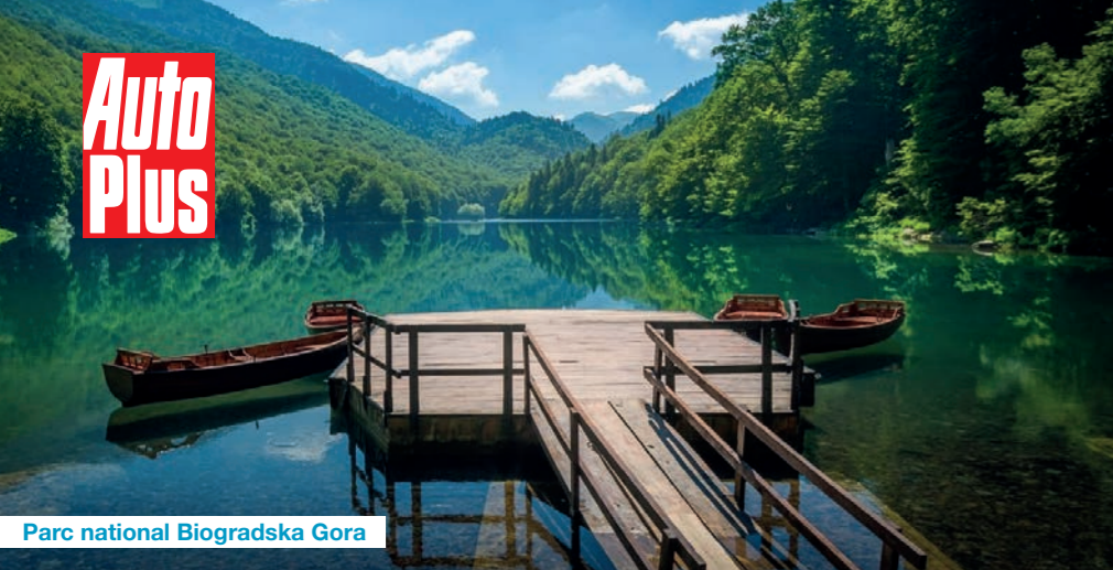
Parc national Biogradska Gora