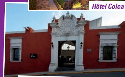
Hôtel Casa Andina Premium Arequipa