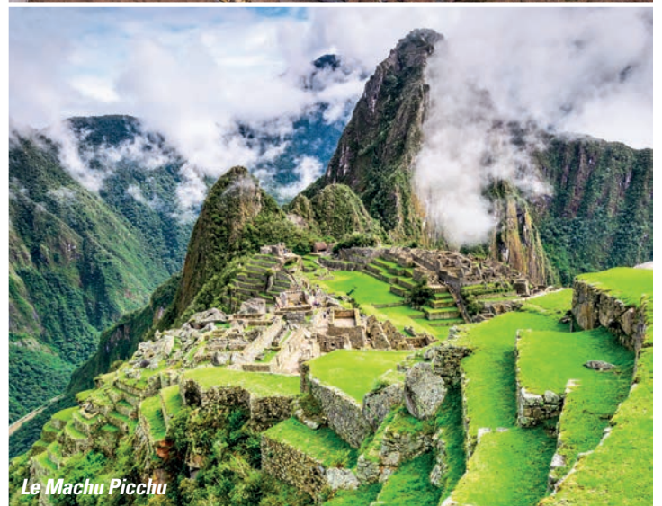
Le Machu Picchu