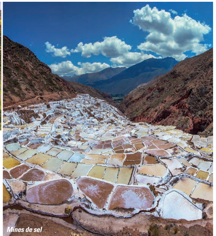
Mines de sel