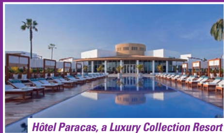
Hôtel Paracas, a Luxury Collection Resort