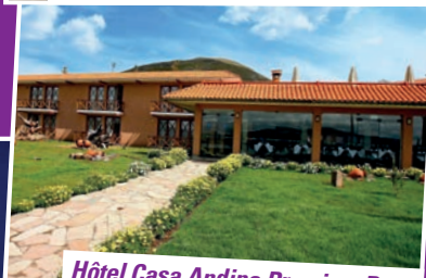
Hôtel Casa Andina Premium Puno