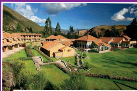
Hôtel Casa Andina Premium Vallée Sacrée