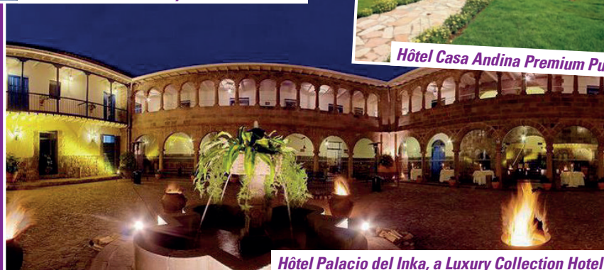
Hôtel Palacio del Inka, a Luxury Collection Hotel