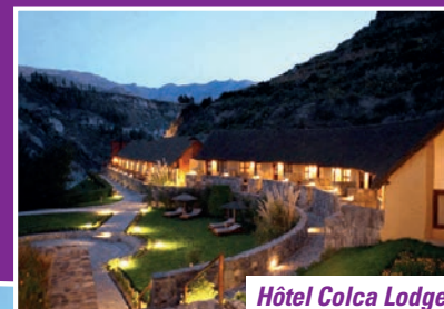
Hôtel Colca Lodge