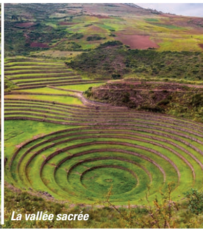
La vallée sacrée