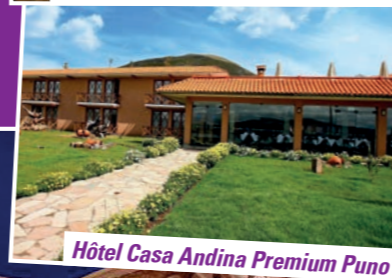
Hôtel Casa Andina Premium Puno