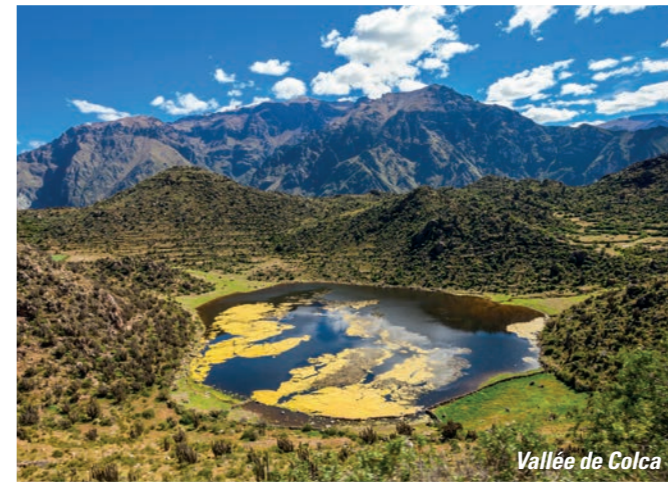
Vallée de Colca