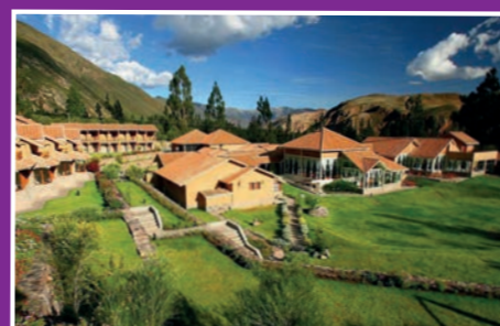
Hôtel Casa Andina Premium Vallée Sacrée