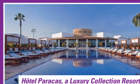
Hôtel Paracas, a Luxury Collection Resort