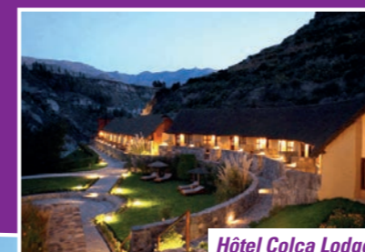
Hôtel Colca Lodge