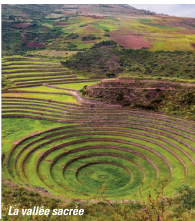
La vallée sacrée