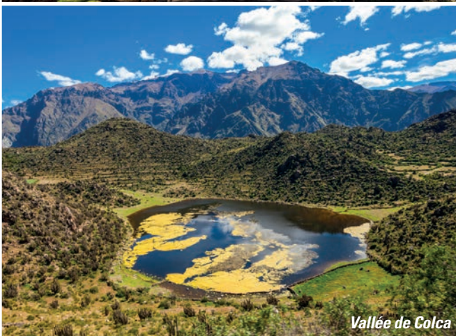
Vallée de Colca