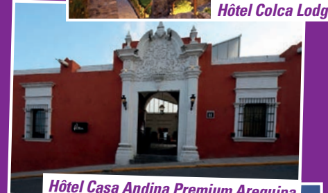
Hôtel Casa Andina Premium Arequipa