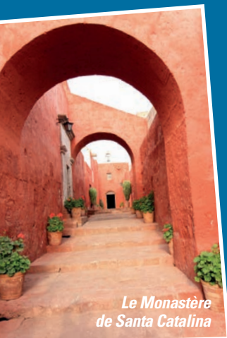
Le Monastère de Santa Catalina