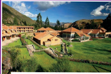
Hôtel Casa Andina Premium Vallée Sacrée