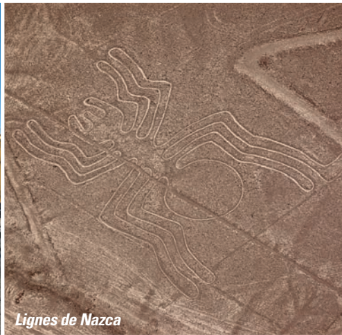
Lignes de Nazca