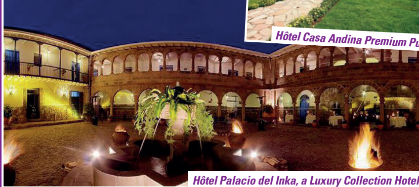
Hôtel Palacio del Inka, a Luxury Collection Hotel