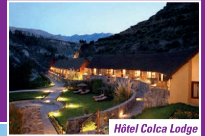
Hôtel Colca Lodge