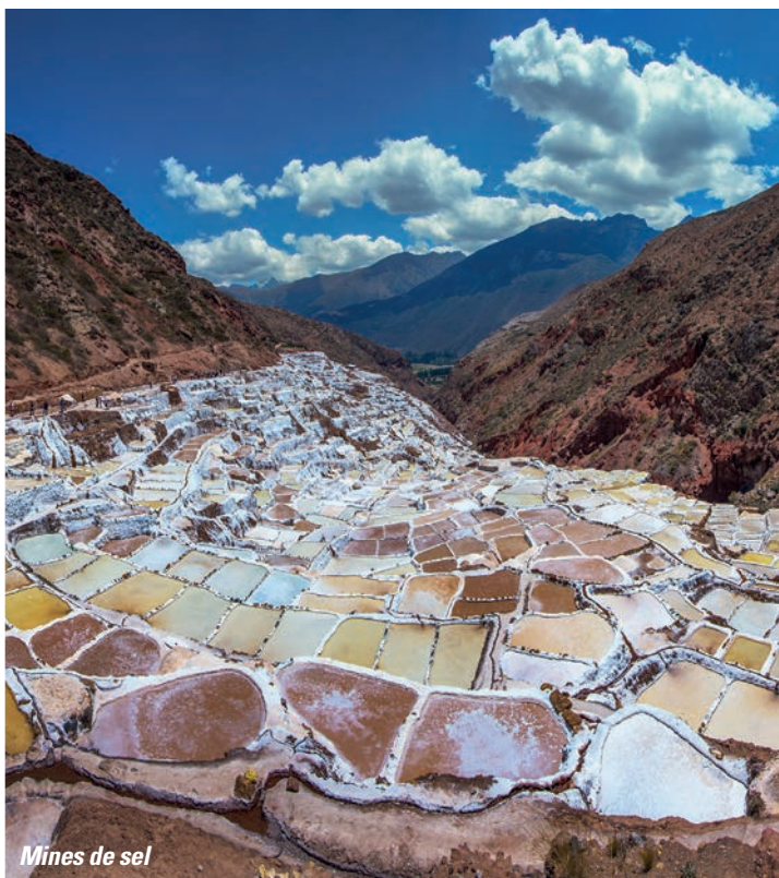
Mines de sel