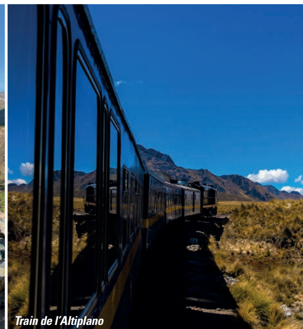
Train de l'Altiplano

La visite se poursuit avec la forteresse de Sacsayhuaman , une des constructions les plus emblématiques des Incas (situées à quelques minutes de la ville) construite par l'inca Pachacutec au XV ème siècle.