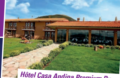
Hôtel Casa Andina Premium Puno