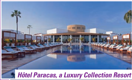
Hôtel Paracas, a Luxury Collection Resort