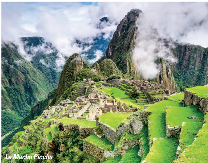
Le Machu Picchu