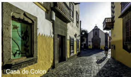
Casa de Colon