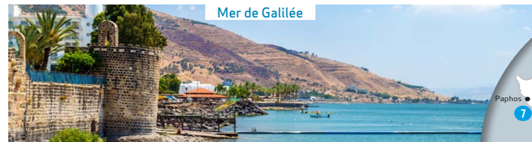
Mer de Galilée