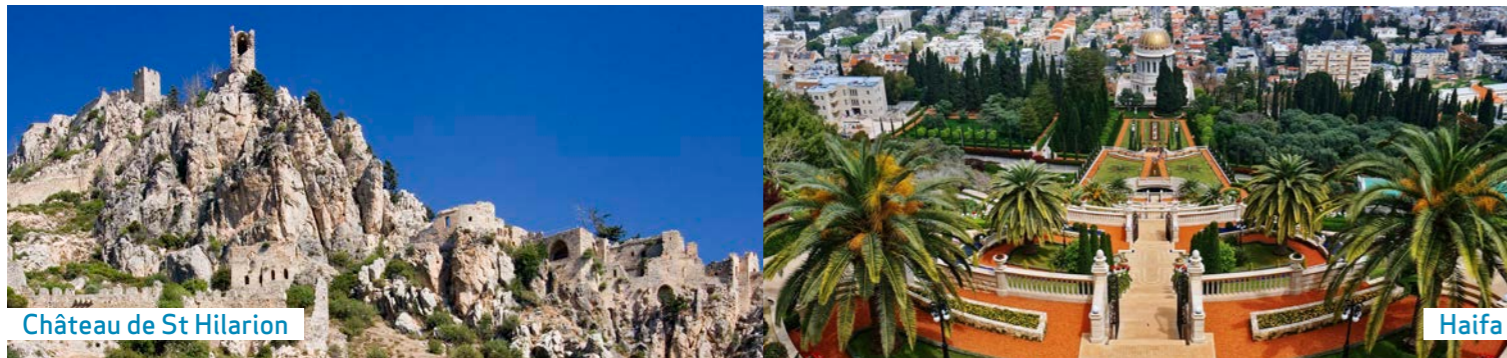
Château de St Hilarion