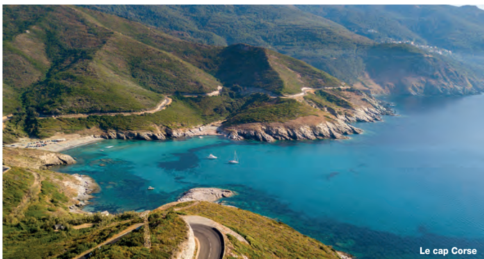
Le cap Corse