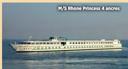
M/S Rhone Princess 4 ancrs

Toutes les cabines sont climatisées et équipées de douche et WC, TV, sèche-cheveux, coffre-fort, radio.