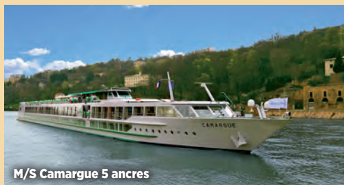
M/S Camargue 5 ancrs

Nous vous proposons deux types de bateaux au choix 4 et 5 ancrs. Ces bateaux à taille humaine vous offriront tout le confort nécessaire pour profiter pleinement de votre croisière sur les plus beaux fleuves de France.