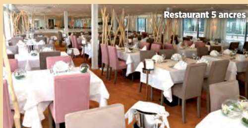
Restaurant 5 ancrs

Tous les bateaux ont reçu la certification SAFE-GUARD du bureau VERITAS , vous assurant un protocole sanitaire strict et la formation des équipages.