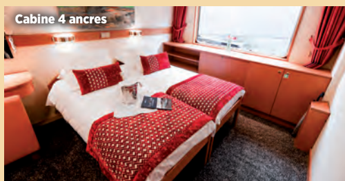
Cabine 4 ancrs

Toutes les cabines sont climatisées et équipées de douche et WC, TV, sèche-cheveux, coffre-fort, radio.