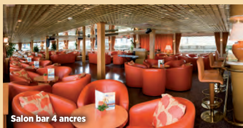
Salon bar 4 ancrs

Salon avec piste de danse et bar. Restaurant savoureux. Salle à manger. Séance de gymnastique. Climatisation et chauffage central, électricité 220V. Wifi à bord.