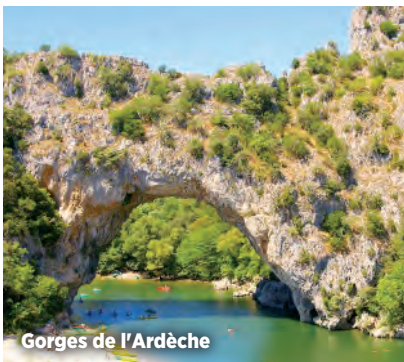
Gorges de l'Ardèche

L'après-midi, vous pourrez visiter les gorges de l'Ardèche au cours d'une excursion facultative commune aux deux forfaits.