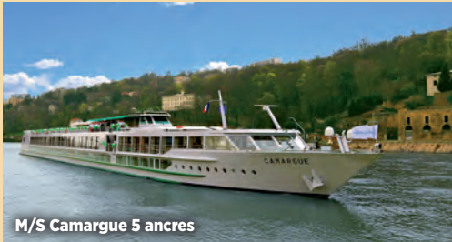
M/S Camargue 5 ancrés

Nous vous proposons deux types de bateaux au choix 4 et 5 ancrés. Ces bateaux à taille humaine vous offriront tout le confort nécessaire pour profiter pleinement de votre croisière sur les plus beaux fleuves de France.