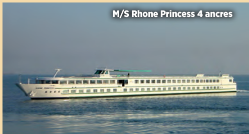
M/S Rhone Princess 4 ancrés

Toutes les cabines sont climatisées et équipées de douche et WC, TV, sèche-cheveux, coffre-fort, radio.