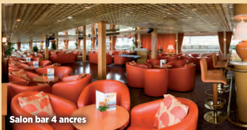
Salon bar 4 ancrés

Salon avec piste de danse et bar. Restaurant savoureux. Salle à manger. Séance de gymnastique. Climatisation et chauffage central, électricité 220V. Wifi à bord.