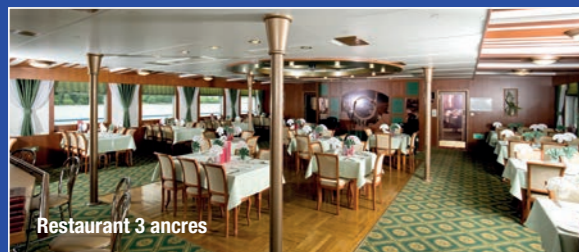
Restaurant 3 ancres

2 restaurants, 2 bars, salle de conférence, salon musical. Boutique de souvenirs, blanchisserie, service médical, un pont soleil avec transats, un solarium et un sauna.