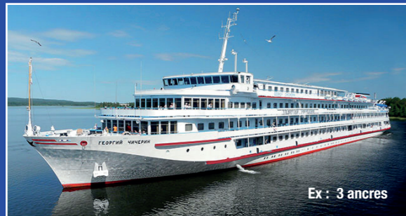
Ex : 3 ancres

En 2021 nous vous proposons deux types de bateaux parfaitement adaptés à la navigation fluviale et offrant toutes les commodités modernes. Deux niveaux de confort au choix : 3 et 4 ancres pour profiter pleinement de votre voyage.