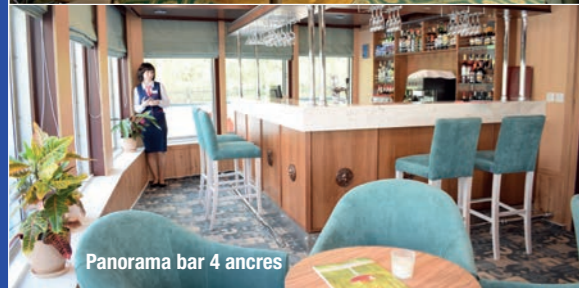
Panorama bar 4 ancres

Pour les passagers à mobilité réduite, nous rappelons qu'il n'y a pas d'ascenseur sur les bateaux et que de nombreuses visites se font à pied.