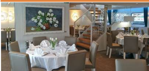
Restaurant 5 ancrés

Les cabines sont dotées de grandes fenêtres pour que vous puissiez admirer les beaux paysages de la vallée. Elles possèdent salle d'eau avec lavabo, douche et toilettes privées, climatisation, coffre-fort.