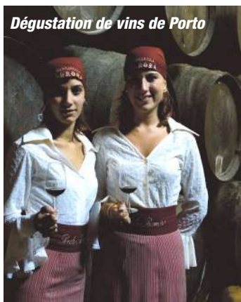
Dégustation de vins de Porto

Vol vers Porto, au départ de Paris (1) . Accueil à bord à partir de 17h. Présentation de l'équipage et cocktail de bienvenue . Découverte optionnelle de Porto "by night" en autocar.