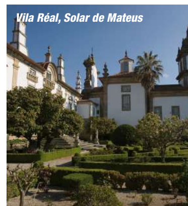
Vila Réal, Solar de Mateus

*Excursion incluse (voir au dos de la brochure).