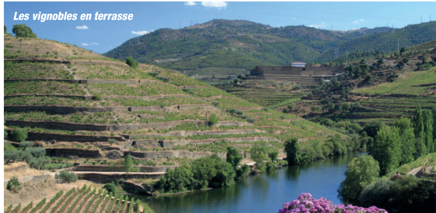
Les vignobles en terrasse