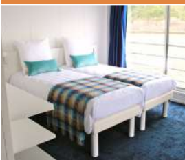
Cabine 5 ancrés

Bateaux d'environ 80 mètres de long, entre 60 et 75 cabines, offrant toutes les commodités modernes et avec deux niveaux de confort au choix : 4 et 5 ancrés.