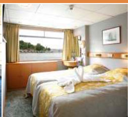
Cabine 4 ancrés