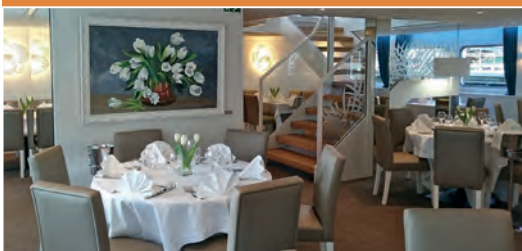
Restaurant 5 ancrés

Les cabines sont dotées de grandes fenêtres pour que vous puissiez admirer les beaux paysages de la vallée. Elles possèdent salle d'eau avec lavabo, douche et toilettes privées, climatisation, coffre-fort.