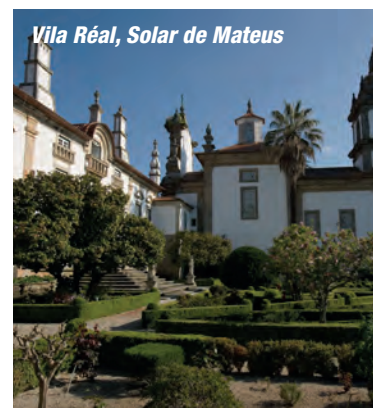
Vila Réal, Solar de Mateus

*Excursion incluse (voir au dos de la brochure).