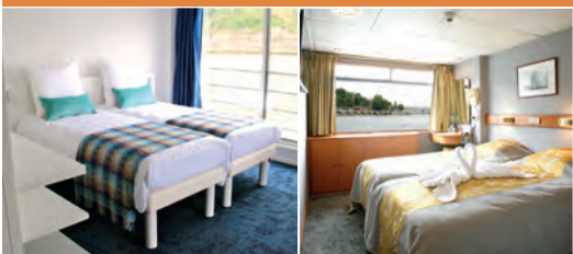
Cabine 5 ancrés

Bâteaux d'environ 80 mètres de long, entre 60 et 75 cabines, offrant toutes les commodités modernes et avec deux niveaux de confort au choix : 4 et 5 ancrés.