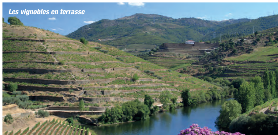
Les vignobles en terrasse