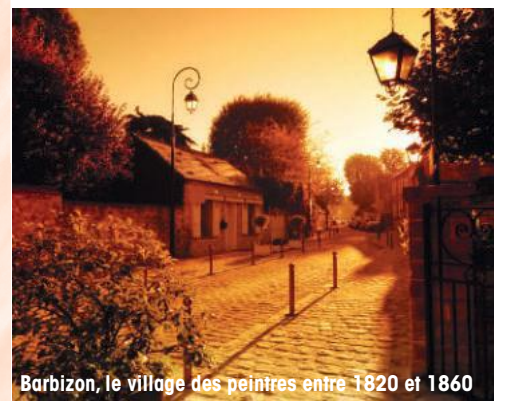
Barbizon, le village des peintres entre 1820 et 1860