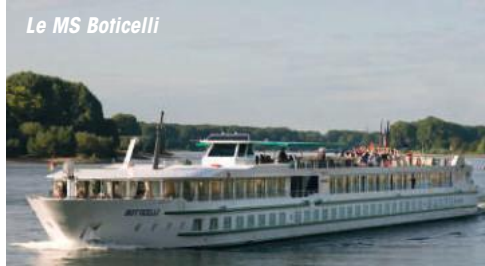
Le MS Boticelli