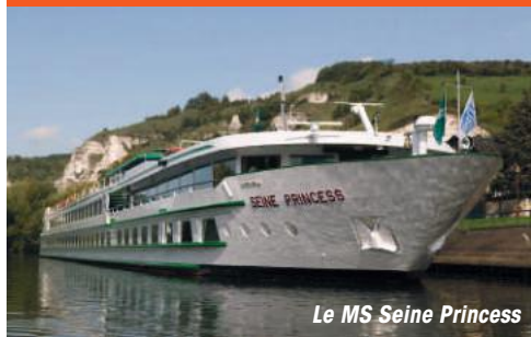
Le MS Seine Princess