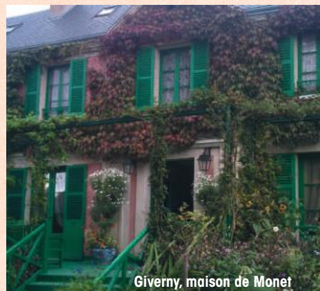
Giverny, maison de Monet

Découverte libre de la maison, qui abrite la collection privée d'estampes japonaises de Monet, et du jardin, véritable havre de verdure.