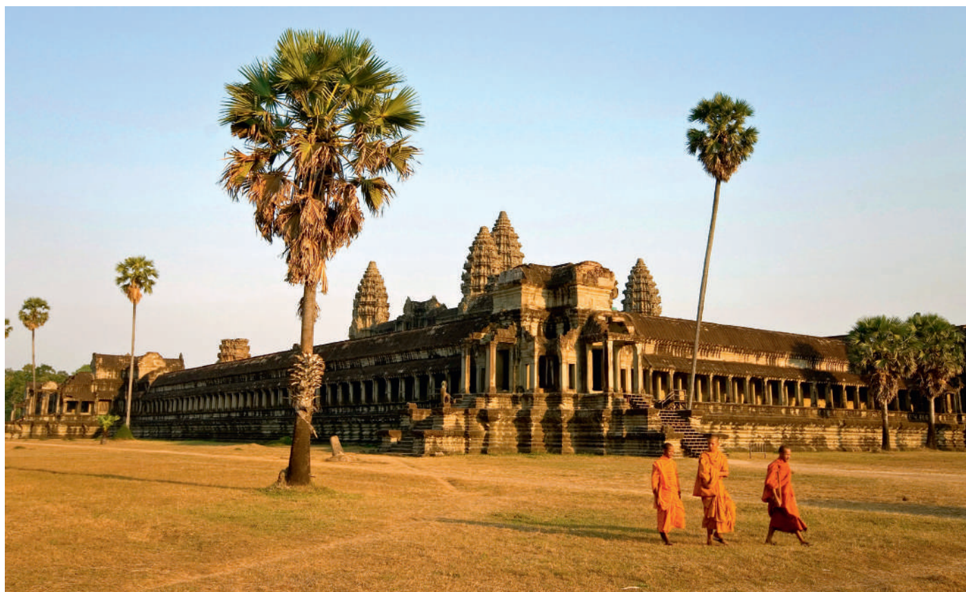
Temples d'Angkor - Cambodge

RENSEIGNEMENTS & RÉSERVATION AU 01 41 33 56 56