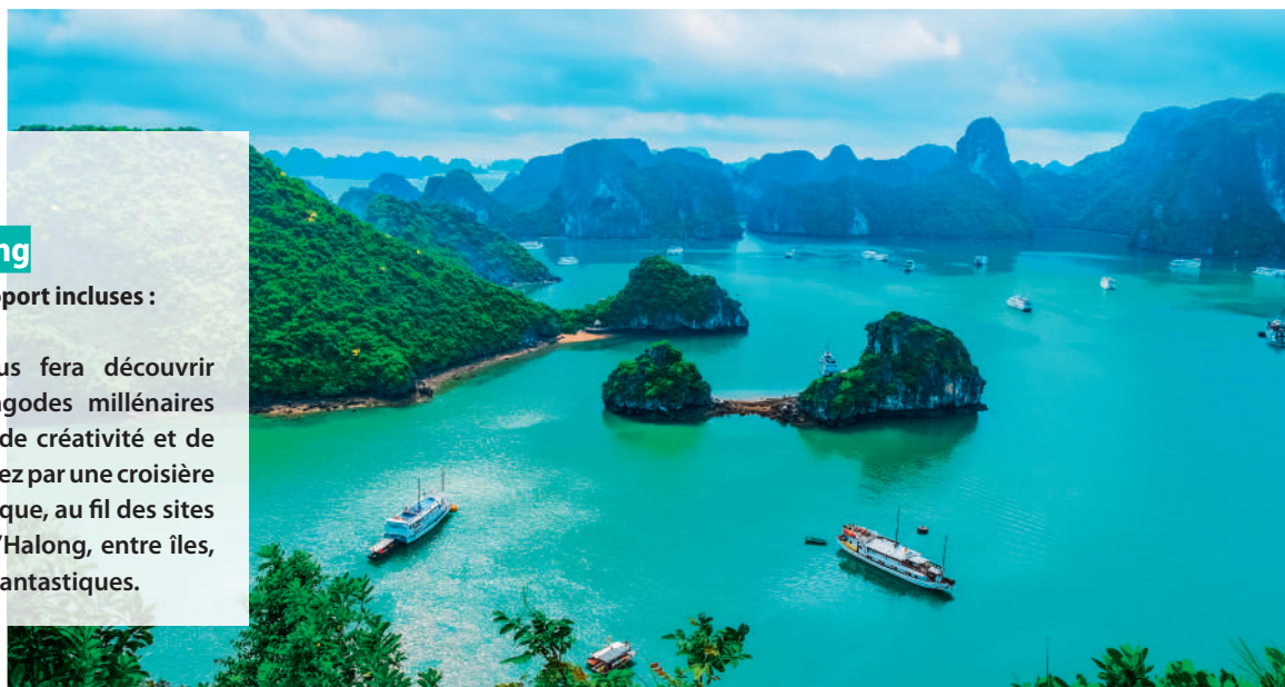
Baie d'Halong - Vietnam

L'extension de 4 jours vous fera découvrir Hanoï, la capitale, entre pagodes millénaires et échoppes qui fourmillent de créativité et de bonne humeur. Vous terminerez par une croisière romantique, à bord d'une jonque, au fil des sites incontournables de la baie d'Halong, entre îles, criques et pitons aux formes fantastiques.