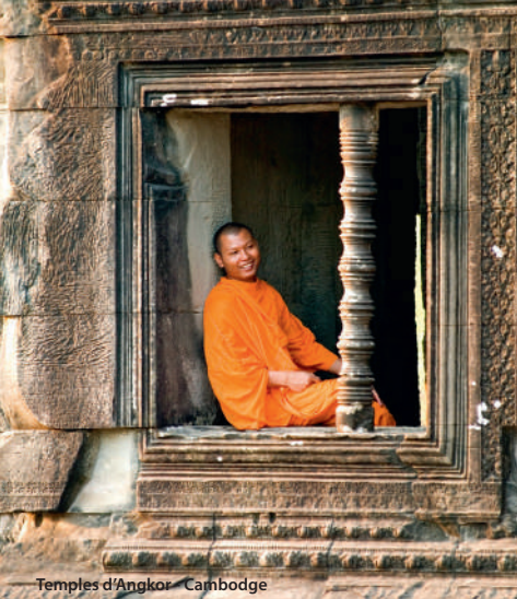
Temples d'Angkor - Cambodge

Que vous ayez, soif de culture, envie de relaxation ou désir de rencontre, ce voyage aux confins du Vietnam et du Cambodge vous fera découvrir de véritables «petits paradis entre ciel et eau» au fil du fleuve Mékong. La magie des temples et des pagodes vous attend ainsi que les us et coutumes de ces peuples généreux et accueillants, sans parler des mille et une saveurs qui flatteront votre palais. Laissez-vous guider, ce voyage inoubliable saura vous combler !