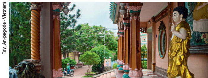
Tay An-pagode - Vietnam

Fondée en 1434, la capitale du Cambodge, grâce à la réhabilitation de son patrimoine architectural, conserve beaucoup de charme. Visite de la Pagode d'Argent et du Palais Royal, coeur symbolique de la nation et l'un des plus beaux exemples d'architecture