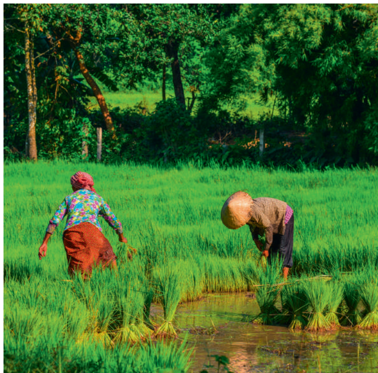
Femmes dans une rizière - Vietnam

Très tôt le matin, magnifique navigation jusqu'à My Tho par le canal de Chao Gao qui permet de passer de la rivière Saigon au delta du Mékong. Petit déjeuner et arrivée à My Tho "La bonne herbe parfumée" selon la traduction est l'un des plus luxuriants jardins du Vietnam (cocotiers, bananiers, manguiers...). Sur la plus grande des îles, Thoi Son, visite d'une ferme d'apiculture et dégustation de thé au miel. Ensuite, navigation dans de petits sampans sur ce canal bordé de palmiers d'eau qui laisse apercevoir la vie des villageois. Retour à bord pour le déjeuner et navigation jusqu'à Vinh Long/Caï Be. Vinh Long, terre rendue riche par les alluvions, est le pays des mandarines et des oranges. Départ en petits bateaux à travers les canaux et les vergers qui mènent vers Cai Be. Découverte d'une briqueterie, d'une pépinière d'arbres fruitiers ainsi que d'une fabrique artisanale de riz soufflé. Puis départ en direction de Sa Dec. Dîner et nuit à bord.