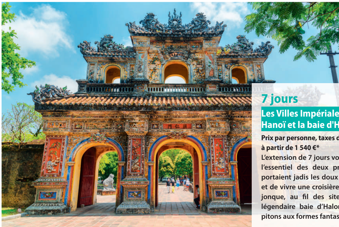
Huế - Vietnam