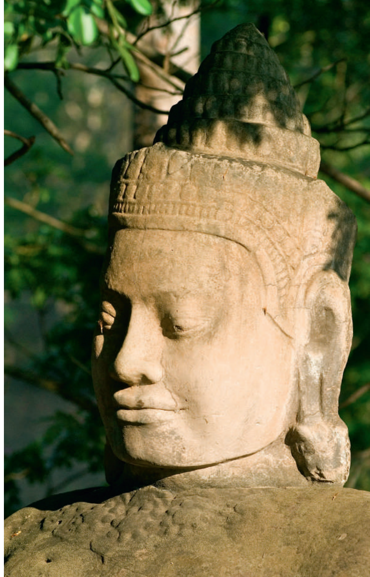
Temples d'Angkor - Cambodge

N.B. : L'itinéraire, les escales ou les visites pourront être modifiés par l'armateur et nos représentants sur place. Les excursions pourront être modifiées ou inversées en cas de nécessité. Le commandant est seul juge pour modifier l'itinéraire du bateau pour des raisons de sécurité et de navigation. *Traversée du lac Tonlé : en période de hautes eaux, en principe d'août à fin novembre, la traversée s'effectue avec le bateau RV Indochine (ou II). En période de basses eaux, de décembre à février, la traversée du lac se fait en bateaux rapides pour rejoindre le RV Indochine (ou RV Indochine II) à Koh Chau. Enfin, en période de très basses eaux, aux environs de février à avril, le transfert de Siem Reap à Koh Chen où se trouve le bateau s'effectue en autocar climatisé / L'abus d'alcool est dangereux pour la santé, à consommer avec modération.