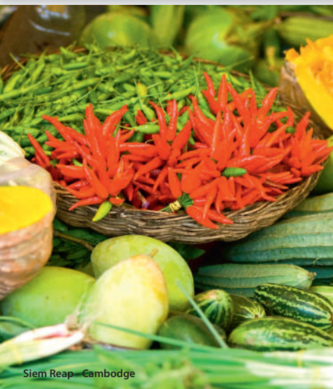
Siem Reap - Cambodge