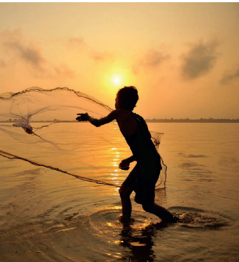
Lac Tonlé - Cambodge

Cocktail et dîner d'au revoir. Nuit à bord.