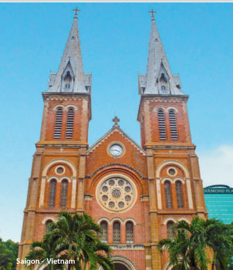
Saigon - Vietnam

Que vous ayez, soif de culture, envie de relaxation ou désir de rencontre, ce voyage aux confins du Vietnam et du Cambodge vous fera découvrir de véritables «petits paradis entre ciel et eau» au fil du fleuve Mékong. La magie des temples et des pagodes vous attend ainsi que les us et coutumes de ces peuples généreux et accueillants, sans parler des mille et une saveurs qui flatteront votre palais. Laissez-vous guider, ce voyage inoubliable saura vous combler !