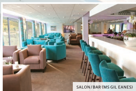
SALON / BAR (MS GIL EANES)