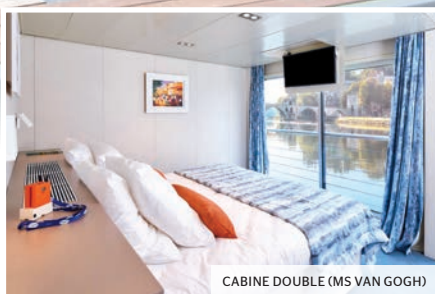
CABINE DOUBLE (MS VAN GOGH)