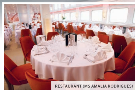
RESTAURANT (MS AMÁLIA RODRIGUES)