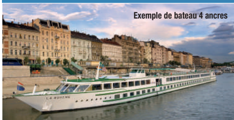
Exemple de bateau 4 ancres

Pour cet itinéraire, nous vous proposons 2 types de navires au choix, 4 et 5 ancres. Ces navires de moins de 100 cabines vous offriront tout le confort nécessaire pour profiter pleinement de votre voyage. En fonction de votre date de départ, vous voyagerez à bord du MS Douce France , MS Monet , MS Gérard Schmitter , MS Beethoven , MS L'Europe , MS Modigliani , MS La Bohème , MS Symphonie , MS Léonardo Da Vinci , MS Lafayette ou MS France .