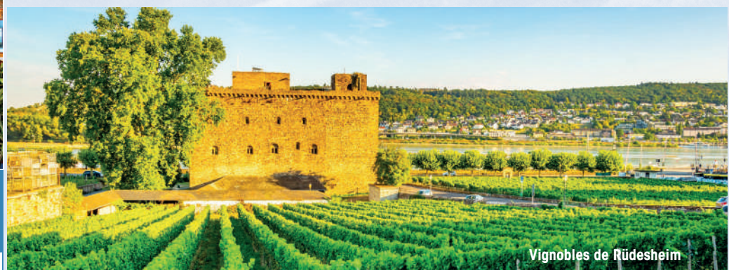
Vignobles de Rüdesheim

Infos & réservation au 01 41 33 56 56. Visitez notre s