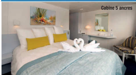
Cabine 5 ancres

Les cabines sont dotées de grandes fenêtres pour que vous puissiez admirer les beaux paysages de la vallée. Elles possèdent salle d'eau avec lavabo, douche et toilettes privées, climatisation, coffre-fort.