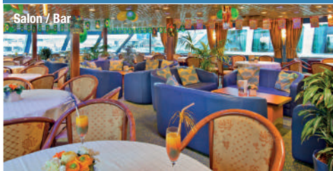
Salon / Bar