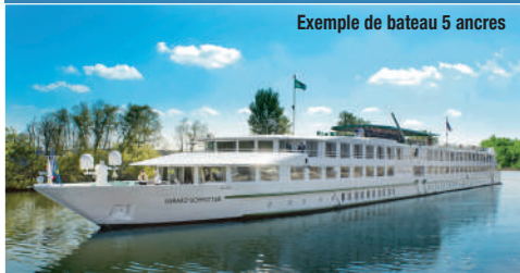
Exemple de bateau 5 ancres

Toutes les cabines sont dotées de vues sur l'extérieur pour que vous puissiez admirer les beaux paysages de la vallée. Elles possèdent salle d'eau avec lavabo, douche et toilettes privées, climatisation, coffre-fort.