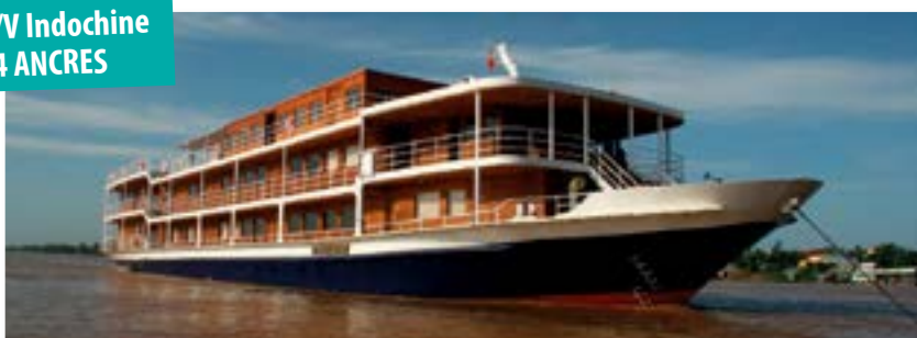
le R/V Indochine 4 ANCRES