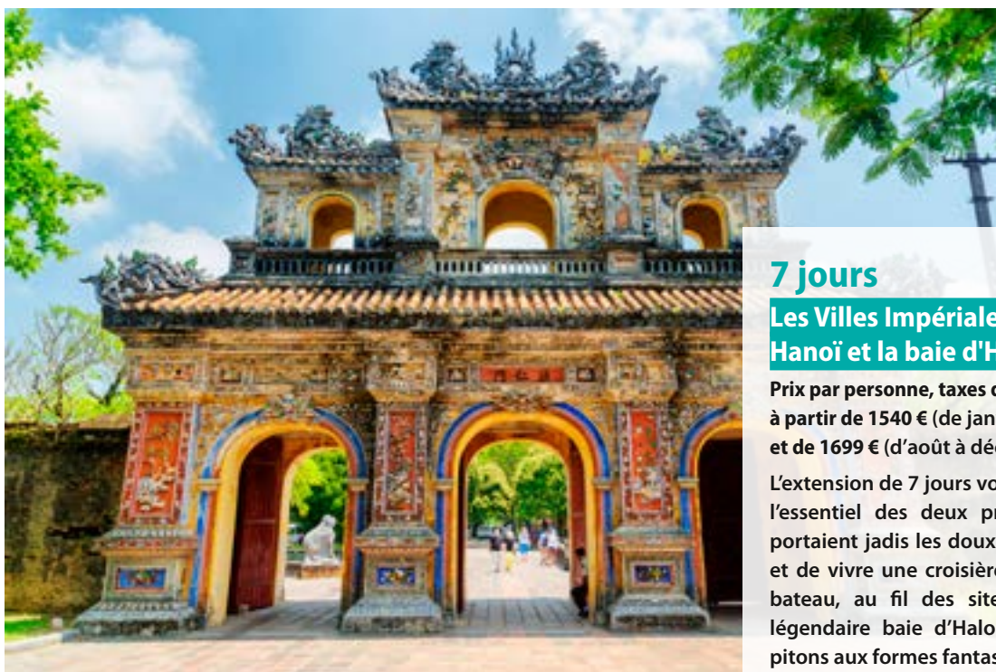
Huế - Vietnam