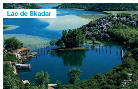
Lac de Skadar

A votre arrivée de Paris par vol direct, vous vous rendez directement au LAC DE SKADAR pour une magnifique croisière sur cette frontière naturelle avec l'Albanie, à l'écosystème unique. Ses méandres et ses îles vous enchanteront.