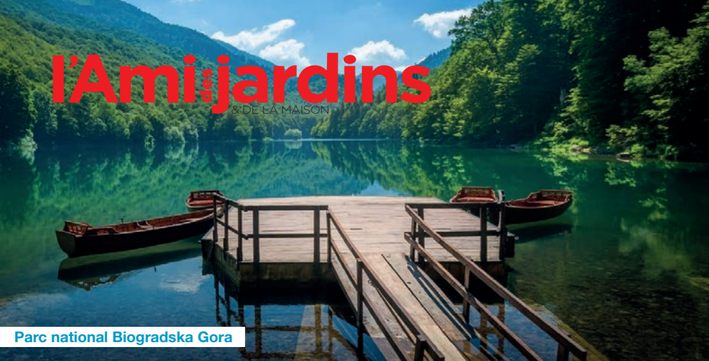
Parc national Biogradska Gora