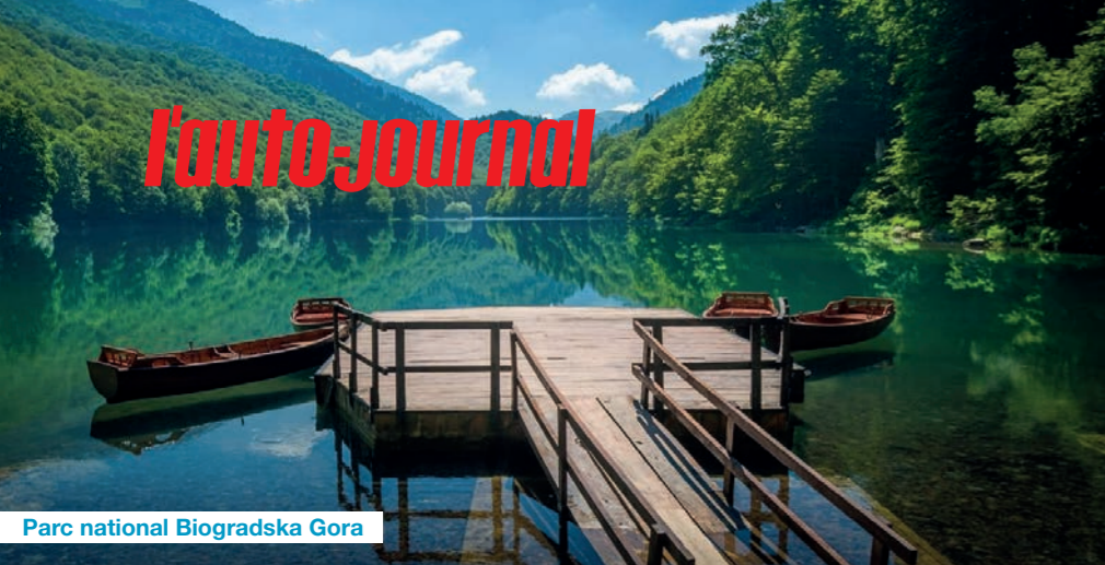
Parc national Biogradska Gora