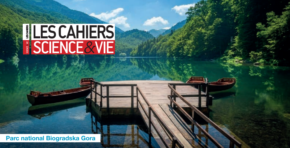
Parc national Biogradska Gora