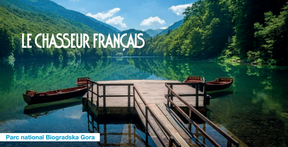
Parc national Biogradska Gora