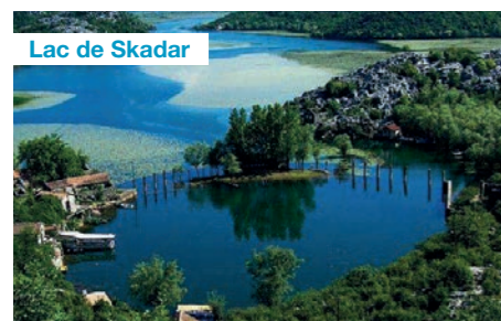
Lac de Skadar

A votre arrivée de Paris par vol direct, vous vous rendez directement au LAC DE SKADAR pour une magnifique croisière sur cette frontière naturelle avec l'Albanie, à l'écosystème unique. Ses méandres et ses îles vous enchanteront.