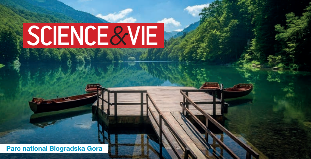
Parc national Biogradska Gora