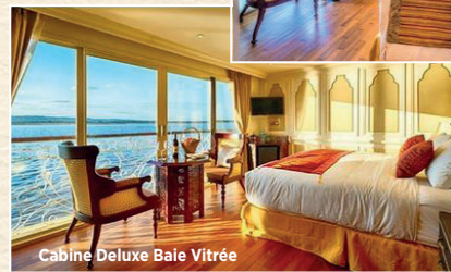
Cabine Deluxe Baie Vitrée