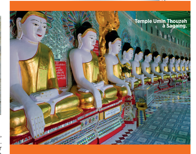
Temple Umin Thouzeh à Sagaing.