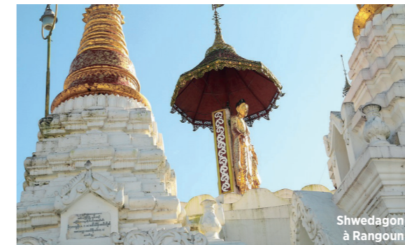
Shwedagon à Rangoun

Tôt le matin, petit-déjeuner à bord, libération des cabines et départ en autocar vers Rangoun. Accueil et transfert vers la plus importante ville de Birmanie, cœur économique du pays. Après le déjeuner en ville, transfert et installation à votre hôtel 4* (normes locales). En fin de journée, visite de l'emblème de Rangoun, la pagode Shwedagon, rayonnant de tous ses éclats sur la colline surplombant la ville. Fondée il y a 2 500 ans, elle protège, selon la légende, les reliques de quatre anciens Bouddha. Dîner en ville et nuit à l'hôtel.