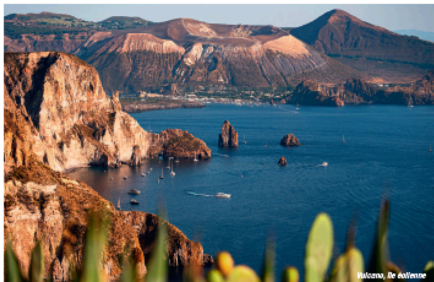
Milazzo, Île Eolienne